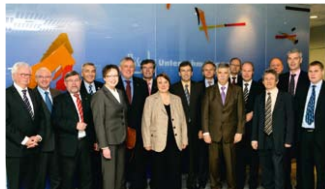
Lenkungskreis der Regionalagentur OWL. Arbeitsmarktpolitisches Gespräch Oktober 2009

Trägerin der Regionalagentur OWL ist die OstWestfalenLippe Marketing GmbH. Die Gesellschaft ist ein Gemeinschaftsunternehmen der Kreise Gütersloh, Herford, Höx-